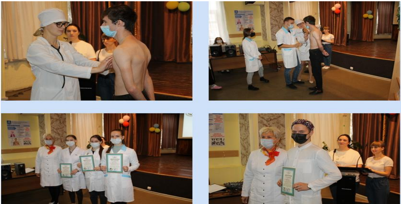
Рис.3. Конференция «Всемирный день борьбы с пневмонией»

Цель: Провести исследования « ЗОЖ в жизни студентов и их семей ».