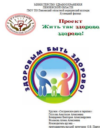
Рис.1. Титульный лист проекта

Вид проекта: практика – ориентированный. Сроки реализации: 2020/2021 – 2022/2023 учебный год. Участники проекта: студенты 1-4 курсов, преподаватели, методист по воспитательной работе, заведующая отделением Сестринское дело