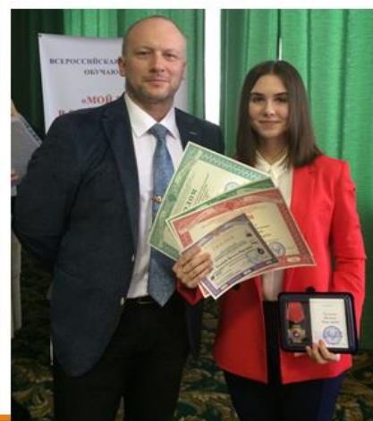
Рис. 7. Победитель конференции

В рамках данной научно-исследовательской работы был апробирован интернет-проект «Пятерочка» (организовано сообщество в VK), где студенты колледжа всегда готовы прийти на помощь, страдающим бронхиальной астмой. Провести индивидуальные занятия по темам Астма-школы, ответить на тревожащие их вопросы. А также, в рамках волонтерства, помочь с записью к врачу, покупке лекарств и т.д. Ссылки на данное сообщество предоставлены всем структурным подразделениям ГБУЗ Кузнецкая МРБ, для возможной организации «Астма-школы» дистанционно и в даже в режиме онлайн. (рис.9)