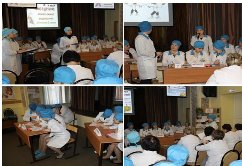
Рис.6. Интеллектуальная игра «Пятерочка»

4 этап Презентация результатов (защита проектов). Завершения работы над проектом, анализ проделанного, самооценка и оценка со стороны, публичная защита результатов проектной деятельности каждой группы.