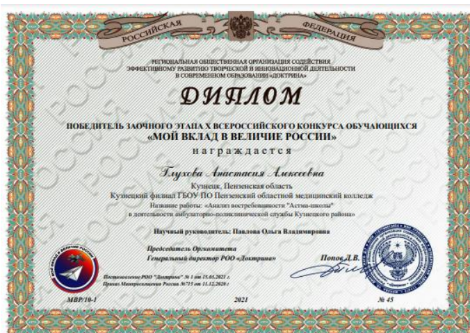
Рис. 8. Диплом победителя

В рамках данной научно-исследовательской работы был апробирован интернет-проект «Пятерочка» (организовано сообщество в VK), где студенты колледжа всегда готовы прийти на помощь, страдающим бронхиальной астмой. Провести индивидуальные занятия по темам Астма-школы, ответить на тревожащие их вопросы. А также, в рамках волонтерства, помочь с записью к врачу, покупке лекарств и т.д. Ссылки на данное сообщество предоставлены всем структурным подразделениям ГБУЗ Кузнецкая МРБ, для возможной организации «Астма-школы» дистанционно и в даже в режиме онлайн. (рис.9)