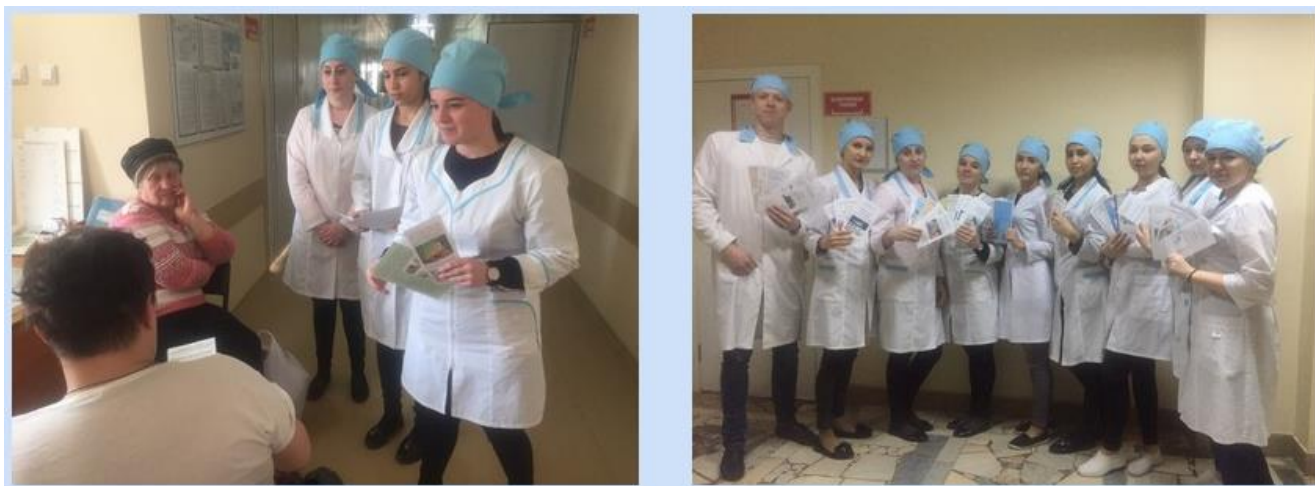
Рис.5. Проведение бесед с пациентами

Игру готовят студенты 4 курса для студентов 3 курса. Руководитель кружка является куратором данного мероприятия. А в состав жюри входят студенты и преподаватели.