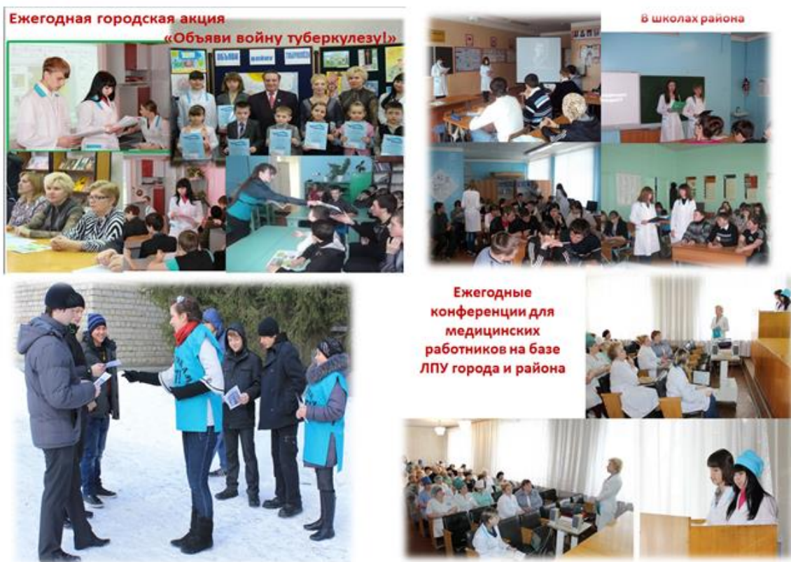
Рис.2. Фотоколлаж акции «Объяви войну туберкулезу!»

2 этап - организация деятельности групп.