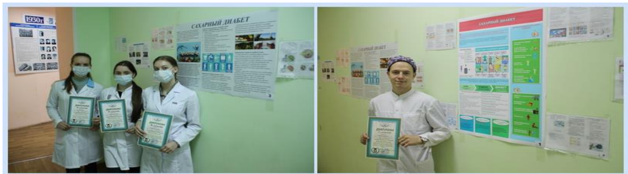
Рис.4. Конкурс сан бюллетеней

Цель: Формирование активной позиции студентов в профилактической деятельности сохранения здоровья населения. (рис. 4)